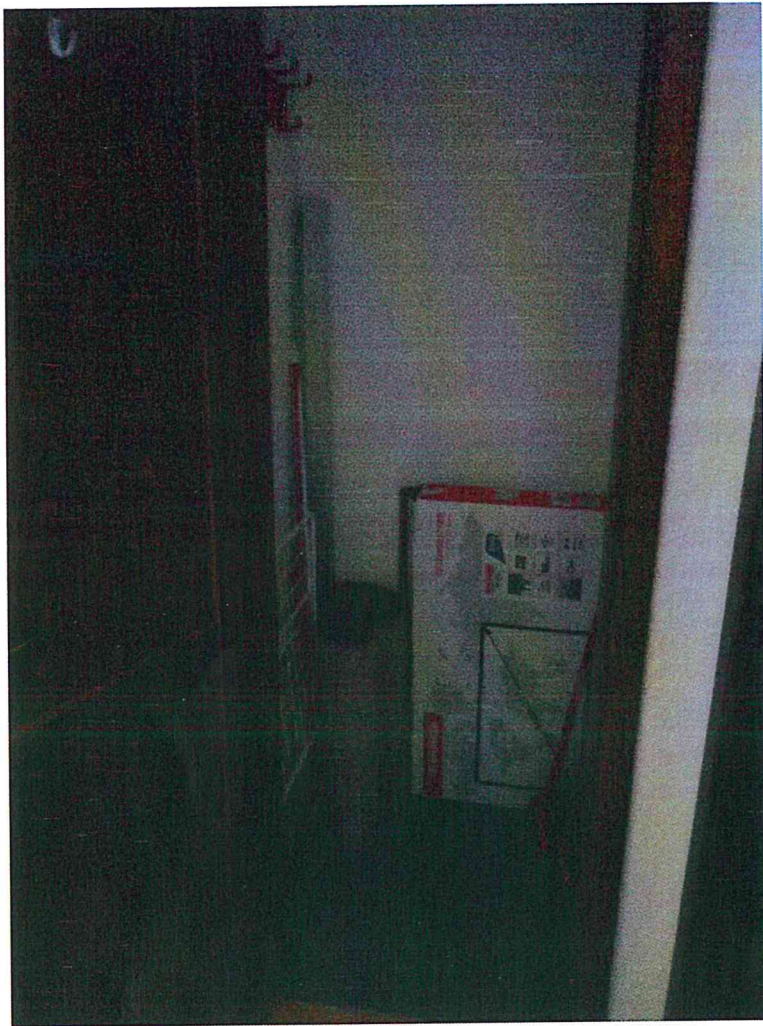
Locale Camera Matrimoniale