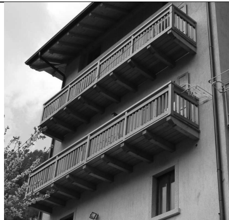
Soluzioni compatibili con le tipologie del centro storico