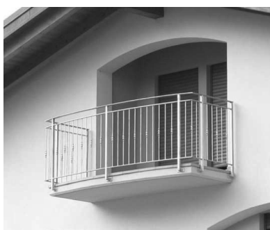
Acciaio zincato Soluzioni non compatibili