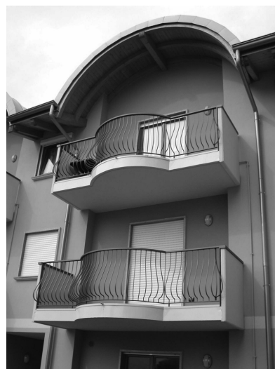
Forme non tradizionali