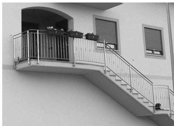
Soluzioni non compatibili