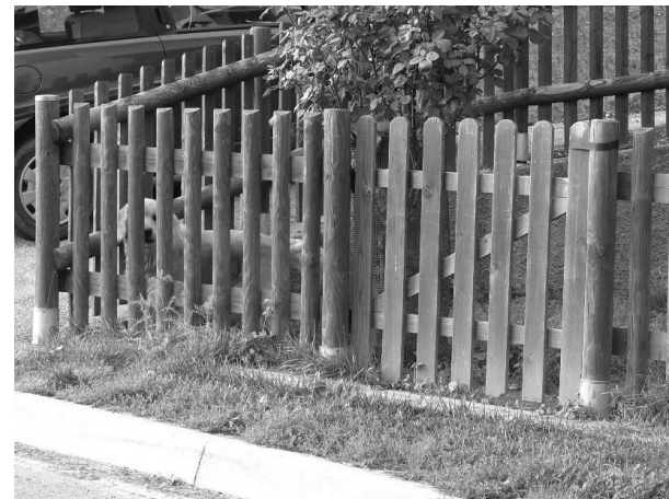
recinzioni da utilizzare in centro storico