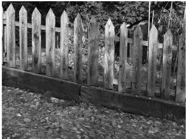
recinzioni da utilizzare in aree agricole