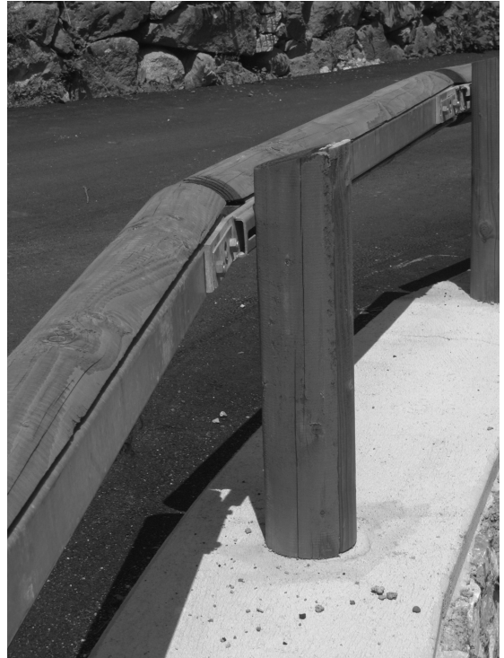
barriere stradali da utilizzare in ambiti paesaggistici soggetti a tutela