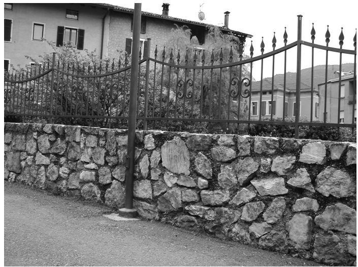
recinzioni da utilizzare in ambiti B e C e Centro storico