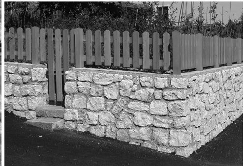
recinzioni da utilizzare in ambiti B e C e Centro storico