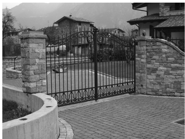
Cancellate da utilizzare in ambiti B e C e Centro storico