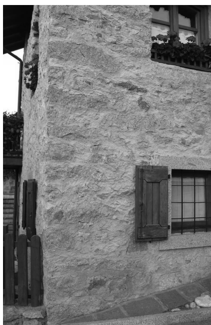
Su edificio risanato