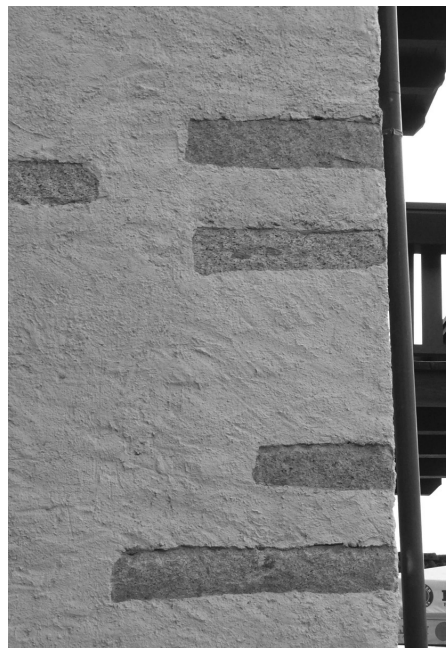
su edificio ristrutturato