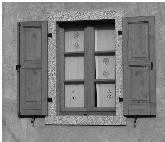
Soluzioni compatibili con le tipologie del centro storico