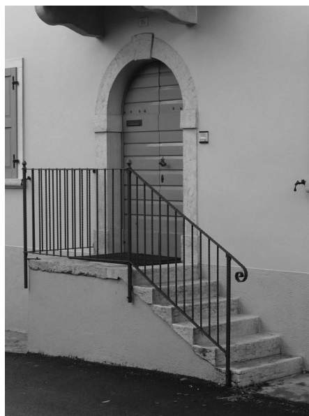
Soluzioni compatibili con le tipologie del centro storico