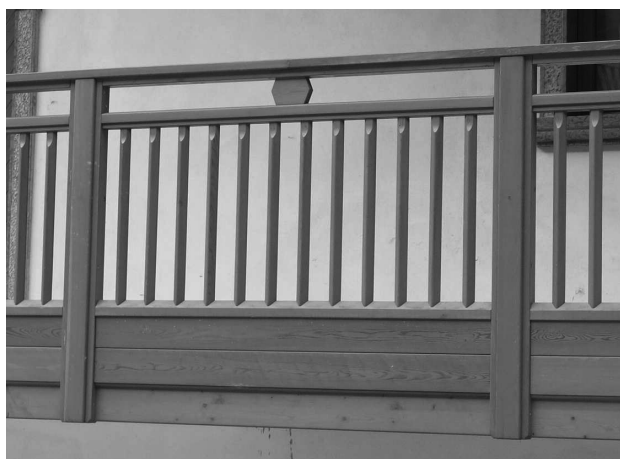
Soluzioni compatibili per interventi in zone di espansione