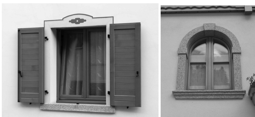
Soluzioni compatibili con le tipologie per le nuove aree residenziali