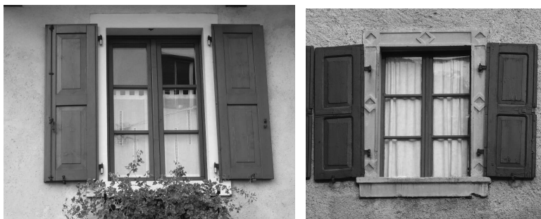
Soluzioni compatibili con le tipologie del centro storico