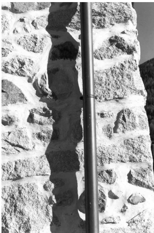
Raso sasso alterato con fughe lisce