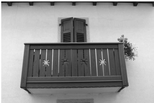
Soluzioni compatibili con le tipologie del centro storico