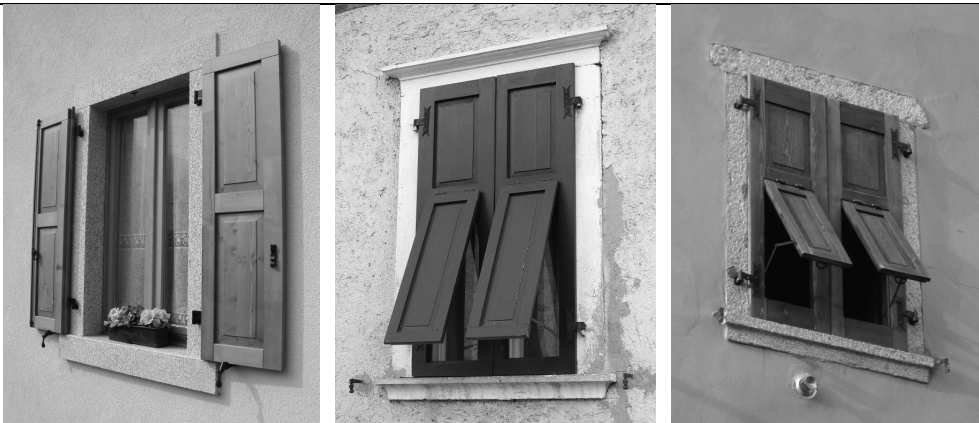
Soluzioni compatibili con le tipologie del centro storico