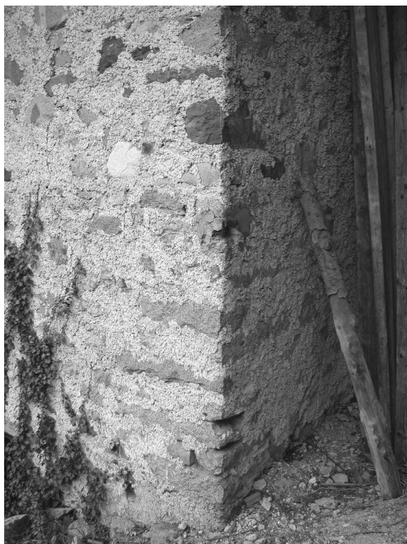
Raso sasso tradizionale