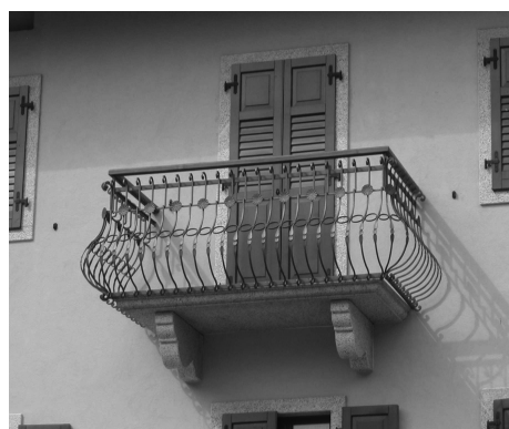
Soluzioni compatibili con le tipologie del centro storico