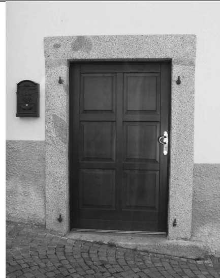
Soluzioni nuove compatibili