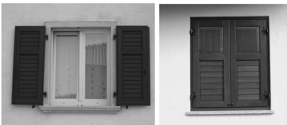
Soluzioni non compatibili con le tipologie per il centro storico