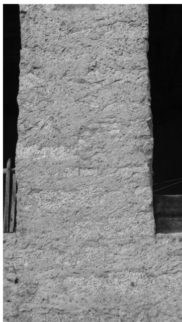
Raso sasso: su rustico originale